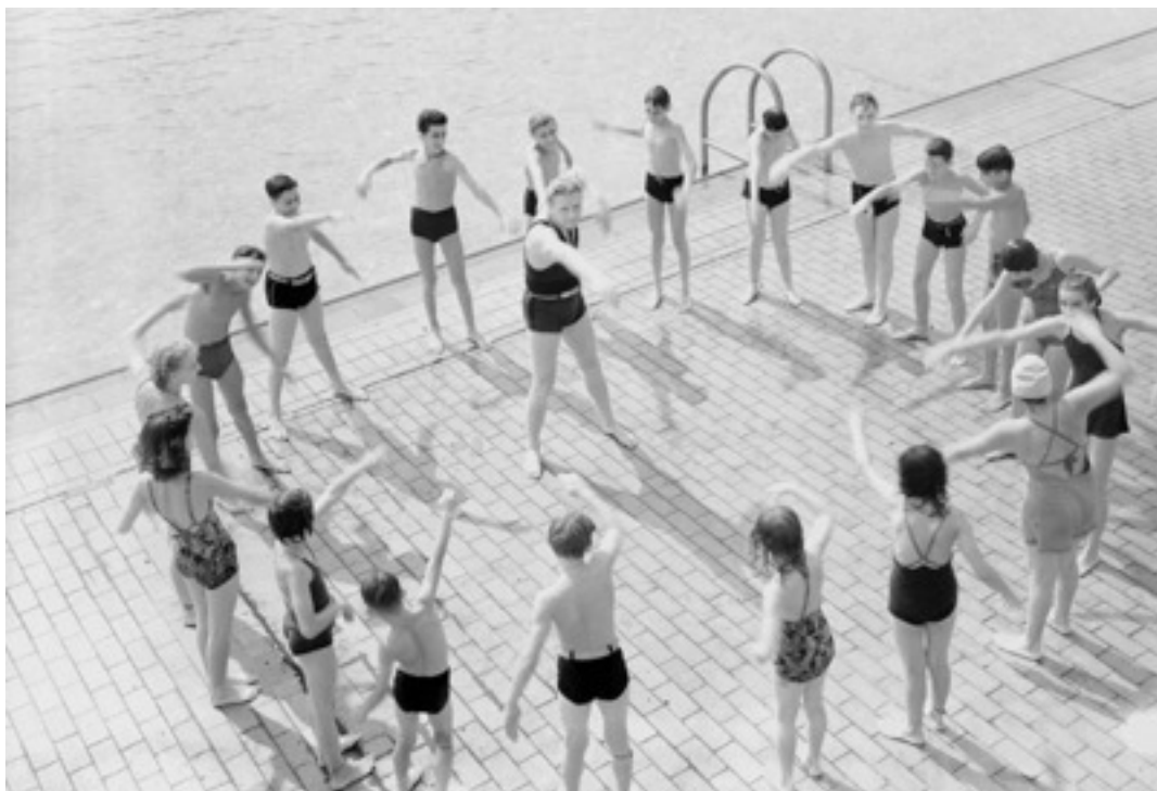
TRENER 1 SYNKRON